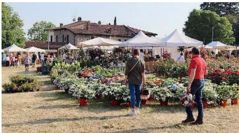
Il meglio del florovivaismo. «Franciacorta in fiore», arriva l'edizione n. 24