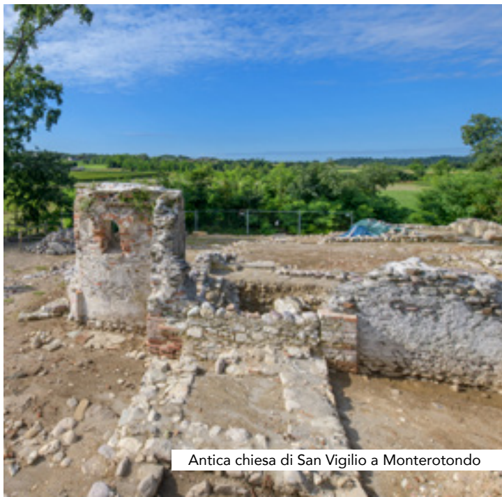
Antica chiesa di San Vigilio a Monterotondo