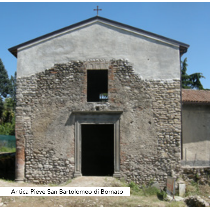
Antica Pieve San Bartolomeo di Bornato